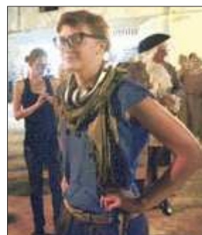
Redateljica Jasmine Žbanić

Snimanju se odazvalo 80 članova Društva i simpatizera koji su svoje uloge odradili volonterski, a za uzvrat od filmske ekipe dobili fotoaparati i printer za potrebe Društva.