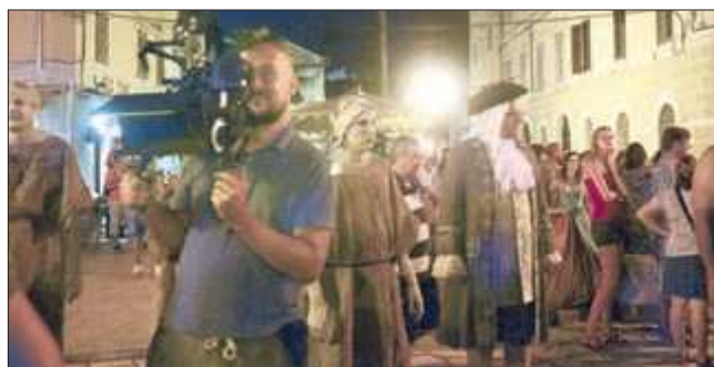
Snimanje na Trgu Marafor

Snimanje na trgu trajalo je cijelu noć, a obuhvaćalo je scene u kojima se protagonisti, bračni par Grebo nalazi u šetnji porečkom starogradskom jezgrom u